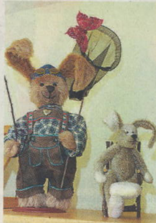
Der angelnde Bär war ein Geschenk für den Ehemann.